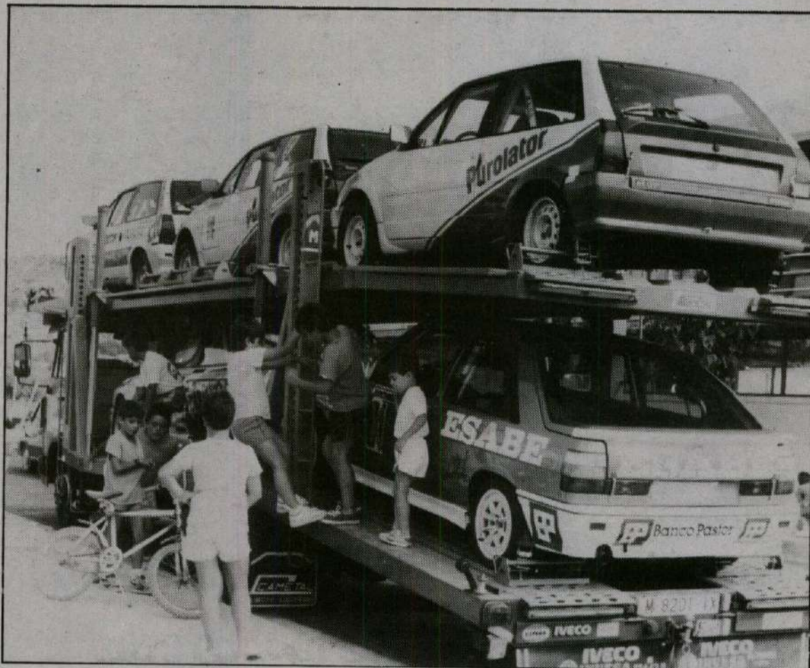
La espectacularidad de la prueba atrae a miles de personas hasta la capital bajoaragonesa.

palmarés de la prueba. Con la ausencia de las copas Renault y Polo, la participación no podrá ser tan alta como en años anteriores, a pesar de que se esperan aproximadamente unos 170 pilotos repartidos entre las cuatro mangas que completan la edición de este año. La participación mayoritaria, se produce en la Copa Citroen AX, con unos 80 vehículos de los 102 que completan el listado para todas las carreras. En la prueba de la Federación Aragonesa se han inscrito 24 vehículos, destacando la participación de 7 pilotos turolenses. En el campeonato de velocidad en circuito se espera la participación de 25 pilotos, entre los que destacan: Luis Pérez Sala, Luis Villamil, Antonio Albacete, López de la Cámara, y un largo etcétera. En los clásicos deportivos la participación puede superar la cifra de 40 vehículos. Por parte turolense además de los participantes en la manga de la federación aragonesa, to-